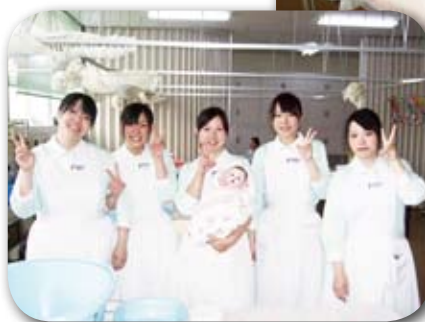
◀看護学生のみなさん