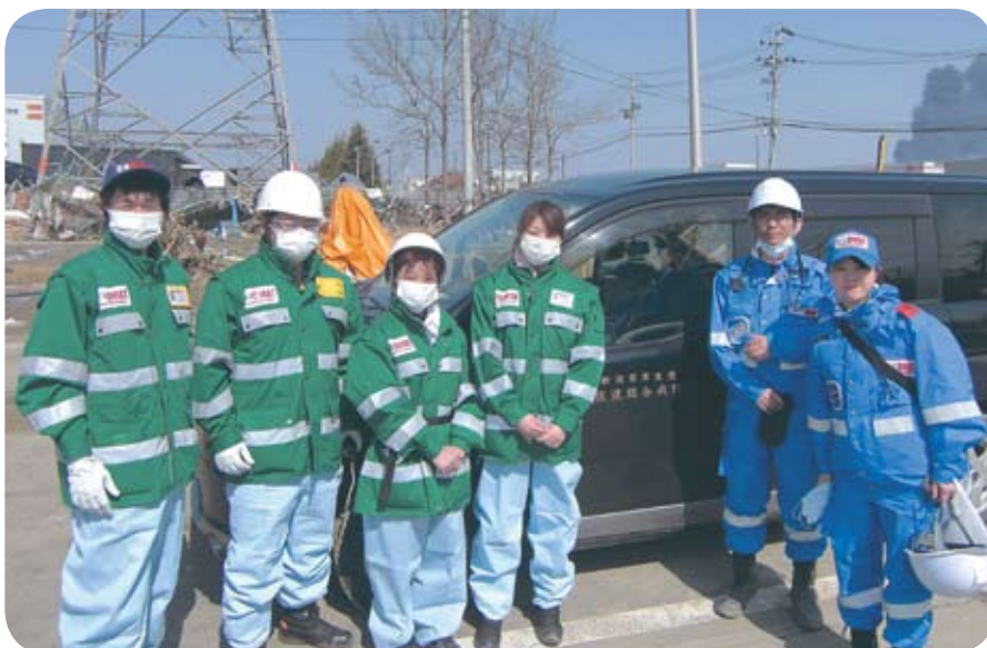
2011.3.12 佐渡DMAT (左4名) と、共に活動した埼玉DMAT (右2名)

その後、佐渡総合病院からも続々と医療支援隊が被災地に出動し医療活動を続けています。被災地においては今後も長い期間での支援が必要であろうと思います。我々、佐渡DMATは、可能な限りの後方支援を行いつつさらに、来たるべき次の出動に向けて準備・訓練を始めています。