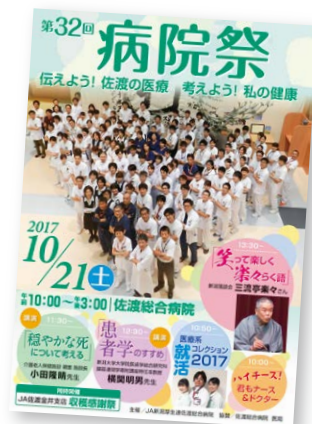
▲昨年の病院祭ポスター