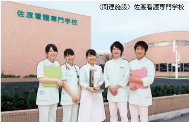
〈関連施設〉佐渡看護専門学校